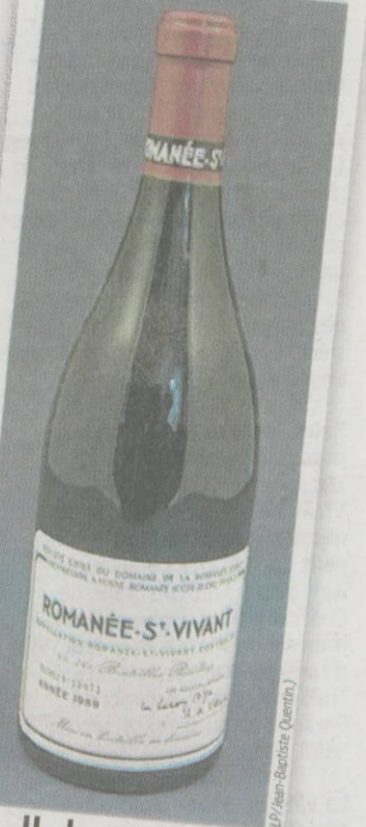
Un bourgogne grand cru