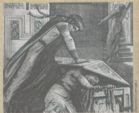
Frédégonde tentant d'étrangler sa fille Rigonde.